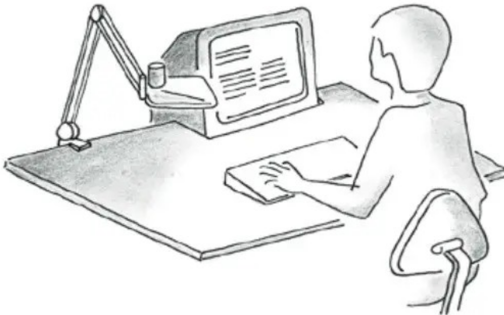
Figur 1 - Lyset bør koncentreres på arbejdsobjektet uden skarpe overgange til omgivelserne.

Blikket rettes naturligt mod de lyseste områder på en genstand. Derfor bør lyset koncentreres på arbejdsobjektet uden skarpe overgange til omgivelserne.